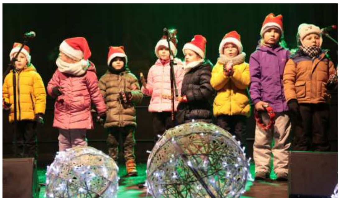
Artystycznym akordem jarmarku były występy przedszkolaków.

Wydarzenie odbiło się szerokim echem wśród mieszkańców. Pod