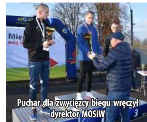
Puchar dla zwycięzcy biegu wręczył dyrektor MOSiW