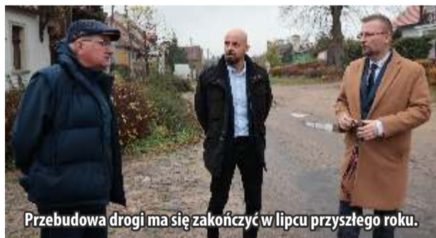
Przebudowa drogi ma się zakończyć w lipcu przyszłego roku.