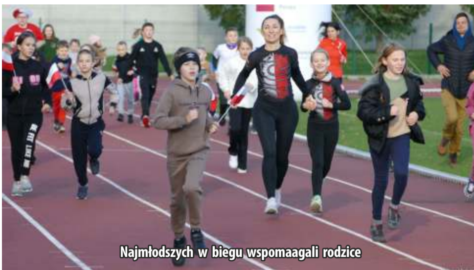
Najmłodszych w biegu wspomagał rodzice