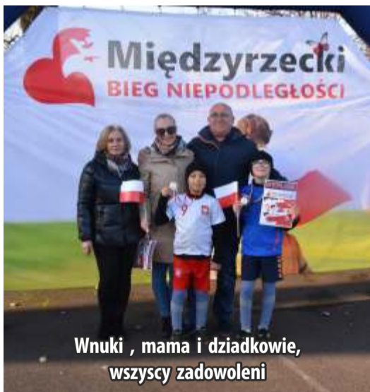
Wnuki, mama i dziadkowie, wszyscy zadowoleni