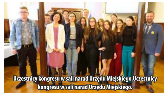
Uczestnicy kongresu w sali narad Urzędu Miejskiego. Uczestnicy kongresu w sali narad Urzędu Miejskiego.

Uczestnicy kongresu opowiadali o swoich pomysłach i działalności: mogli też wysłuchać rad doświadczonych samorządowców: bur-