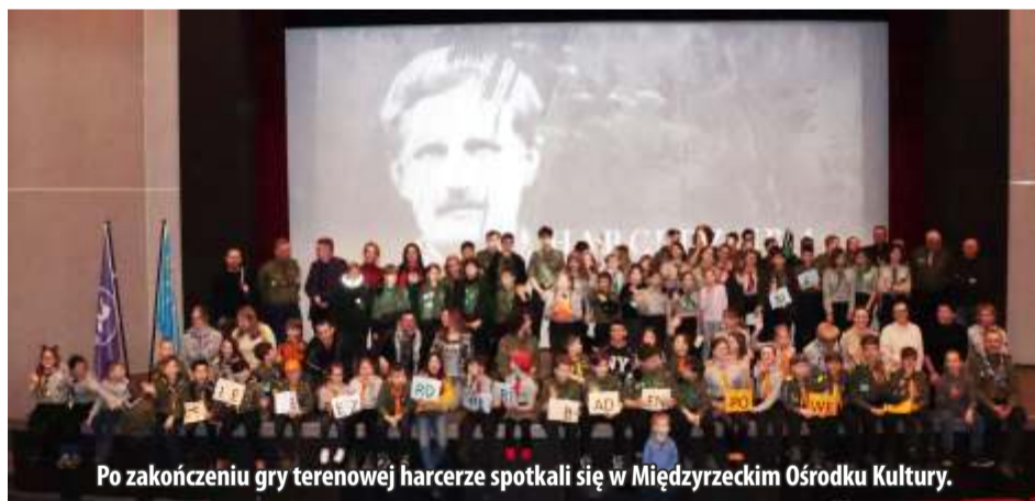
Po zakończeniu gry terenowej harcerze spotkali się w Międzyrzeckim Ośrodku Kultury.