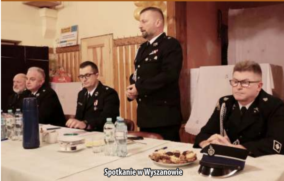
Spotkanie w Wyszanowie