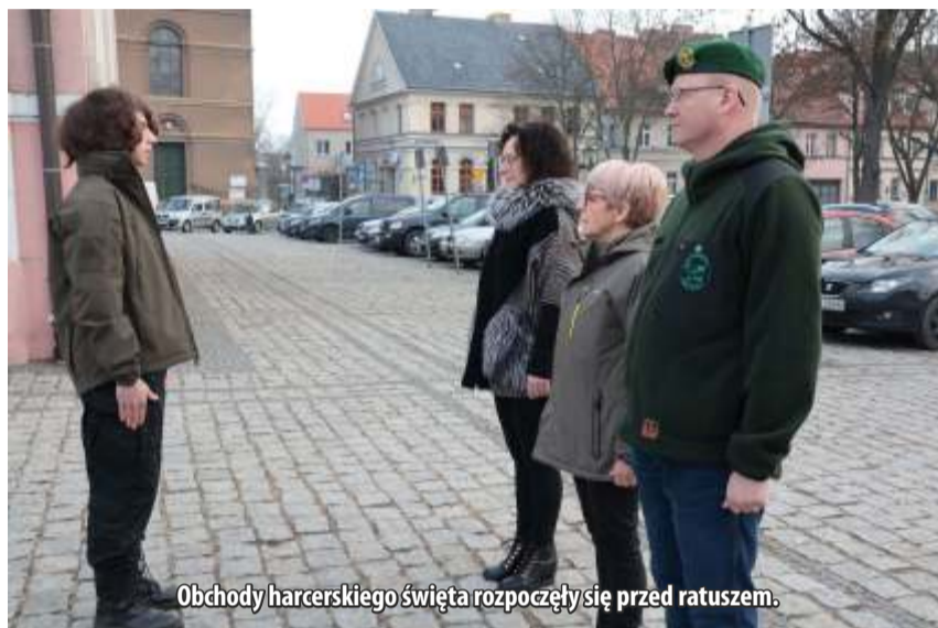
Obchody harcerskiego święta rozpoczęły się przed ratuszem.

Spotkanie przed ratuszem było pierwszą odsłoną obchodów święta. Po zakończeniu ceremonii harcerze wzięli udział w grze terenowej, którą podsumowali po południu w Międzyrzeckim Ośrodku Kultury. Obejrzeni tam film o