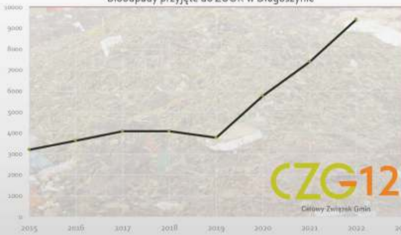
Bioodpady przyjęte do ZUOK w Długoszyńcu

Odzysk w wyniku recyklingu biologicznego pozwala na wytworzenie cennego materiału do uprawy roślin oraz pozwoli gminom na osiągnięcie wymaganych poziomów recyklingu. Pod koniec lutego 2023 r. Celowy Związek Gmin CZG-12 otrzymał Decyzję Ministra Rolnictwa i Rozwoju Wsi w sprawie dopuszczenia polepszacza glebowego do sprzedaży. Celowy Związek Gmin CZG-12 zamierza przyszłości uruchomić sprzedaż polepszacza glebowego dla osób indywidualnych. Polepszacz glebowy będzie można stosować: do rekultywacji, do roślin ozdobnych i trawników, do roślin sadowniczych, do uprawy warzyw, do stosowania na użytkach zielonych.