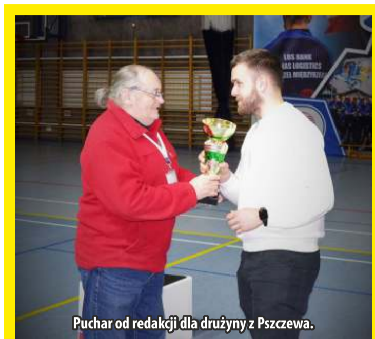
Puchar od redakcji dla drużyny z Pzczewa.