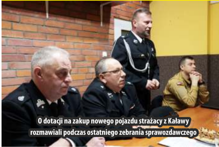
O dotacji na zakup nowego pojazdu straży z Kaławy rozmawiali podczas ostatniego zebrania sprawozdawczego