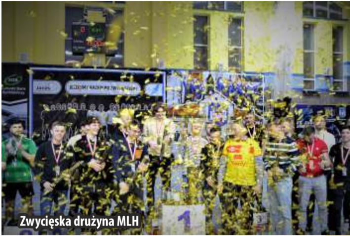
Zwycięska drużyna MLH