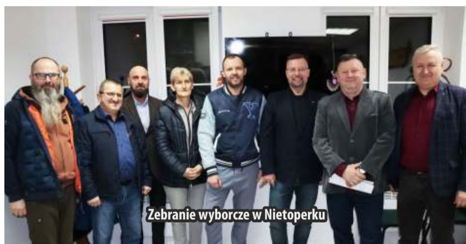
Zebranie wyborcze w Nietoperku

W sołectwach Gminy Międzyrzecz dobiega końca kampania wyborcza, o której informowaliśmy już w poprzednim wydaniu „Przekroju Lokalnego”.