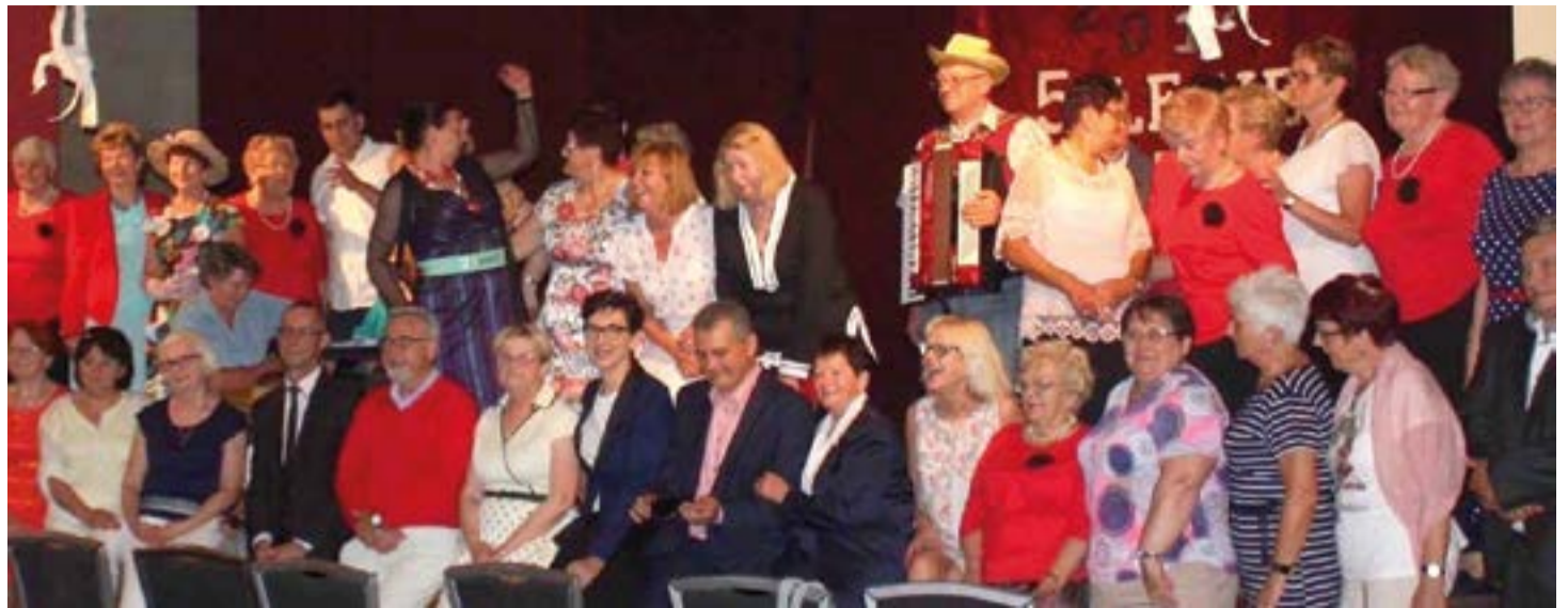
5-lecie Uniwersytetu Trzeciego Wieku w Nowym Miasteczku

K. Osos: Spotykając się z seniorami widzę jak fantastyczni, pełni pasji i energii są to ludzie. Chcą żyć aktywnie, bo umówmy się nie straszna jest starość, straszna jest samotność. Dlatego ważne jest aby Państwo usuwało przeszkody, które wykluczają seniorów z aktywnego życia społecznego. Pamiętajmy, że seniorzy są nieocenionym źródłem tzw. wiedzy pragmatycznej czyli wiedzy budowanej na podstawie długoletnich życiowych i zawodowych doświadczeń. Pozwolić im zamknąć się w domach to byłby wielki błąd. Młodsze