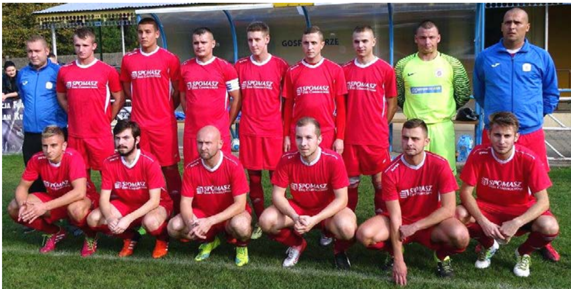
Słaba postawa Stali Jasień w pierwszej połowie sezonu