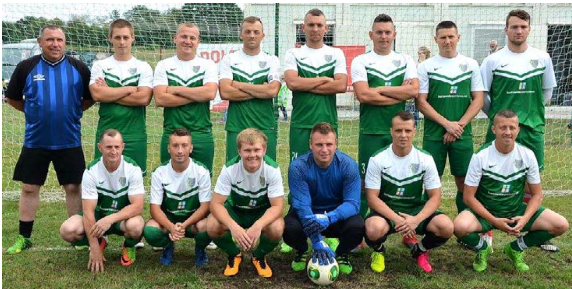
Sparta Mierków zajmuje obecnie 3. miejsce w tabeli