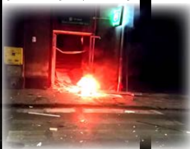
Po wybuchu bankomat razem z drzwiami i wyleciał na ulicę.