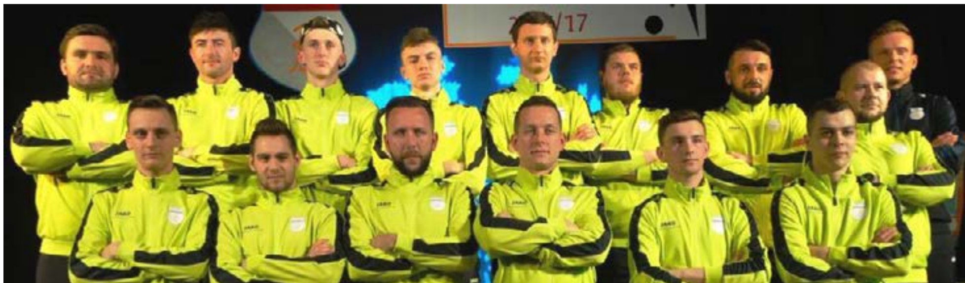
Budowlani Lubsko w rundzie jesiennej spisali się poniżej oczekiwań

Gra naszych lokalnych zespołów piłkarskich w rundzie jesiennej sezonu 2017/2018 to istna sinusoida. Są zespoły, które spisują się bardzo dobrze i mile nas zaskakują: Sparta Mierków w rozgrywkach A-klasy i II drużyna Budowlanych Lubsko w B-klasie. Za solidny zespół zapewne możemy uznać Kado Górzyn w A-klasie. Smućą zespoły w wyższych ligach: miejsce w strefie spadkowej Budowlanych Lubsko w IV lidze lubuskiej, Stal Jasień ostatnie miejsce w lidze okręgowej oraz 15. Miejsce Błękitnych Zabłocie w A-klasie.