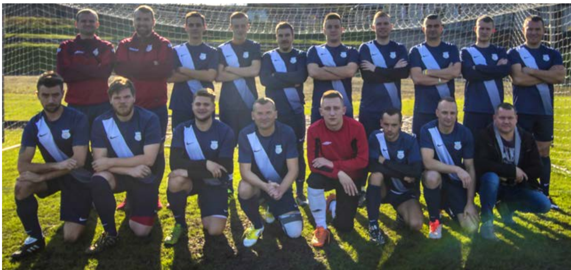
Rezerwy Budowlanych po słabym początku sezonu wędrują w górę tabeli