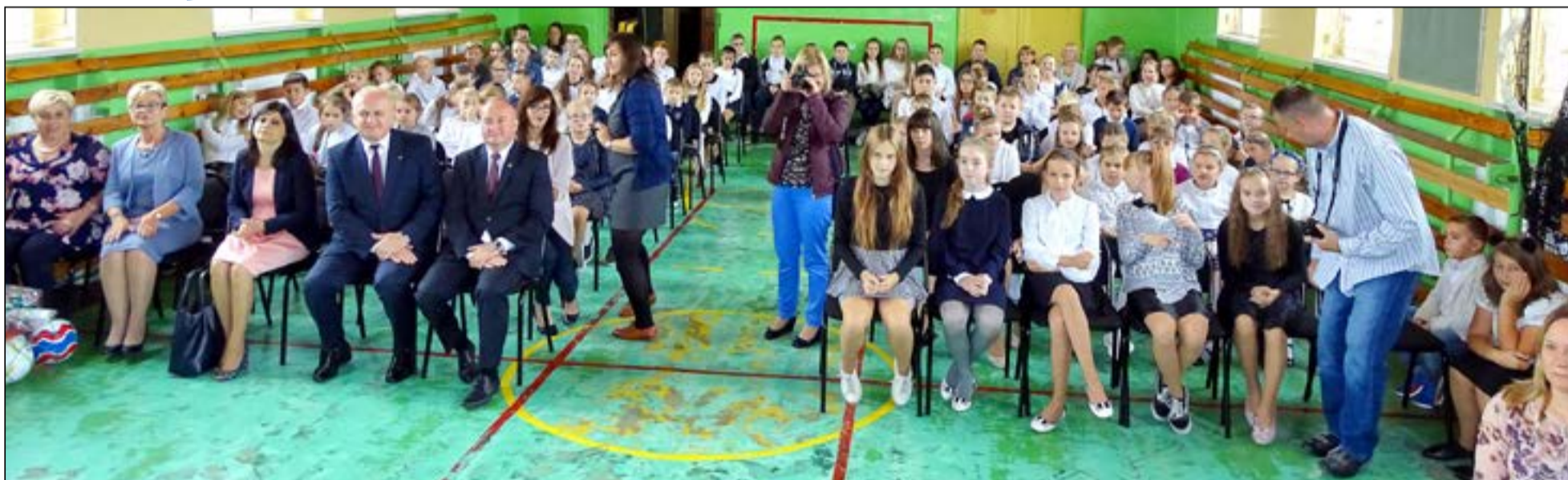
W szkole w Jasieniu, na gościa czekał program artystyczny przygotowany przez dzieci i nauczycieli