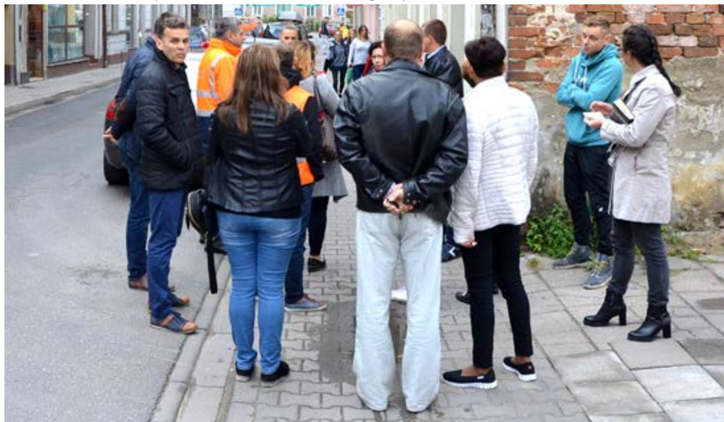
Nowa propozycja Burmistrza Lubka to postawienie zakazu na wysokości filarów.

Argumenty przewodniczącego komisji trafiły do pozostałych radnych i do włodarza gminy. Za takim rozwiąza-