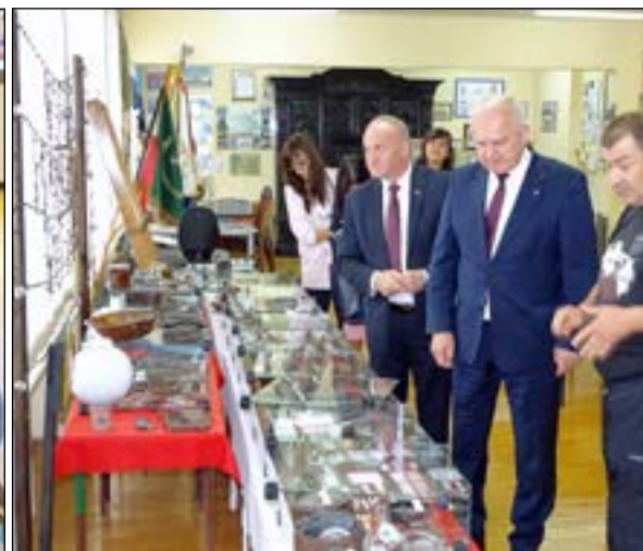
Jasieńska Izba Pamięci i jej ekspozyty wzbudziła duże zainteresowanie gościa z Gorzowa