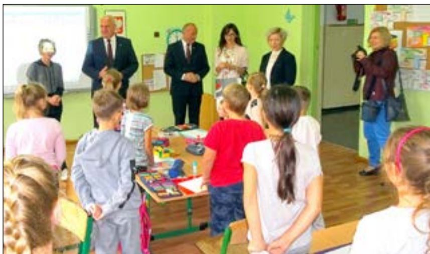
Wojewoda Lubuski odwiedził Szkołę Podstawową w Wicinie