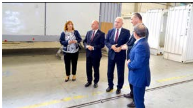
Jasieńskie zakłady pracy mają się czym pochwalić