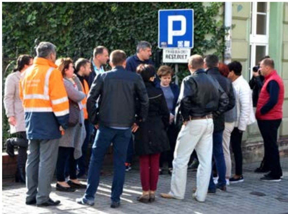
Na spotkaniu pojawili się kupcy, przedstawiciele Zarządu Dróg Wojewódzkich i Burmistrz Lubka.

Dyskusja w sprawie rozwiązania korków na ul. Reja, toczyła się głównie na komisji bezpieczeństwa Rady Miejskiej w Lubsku. Jej przewodniczący