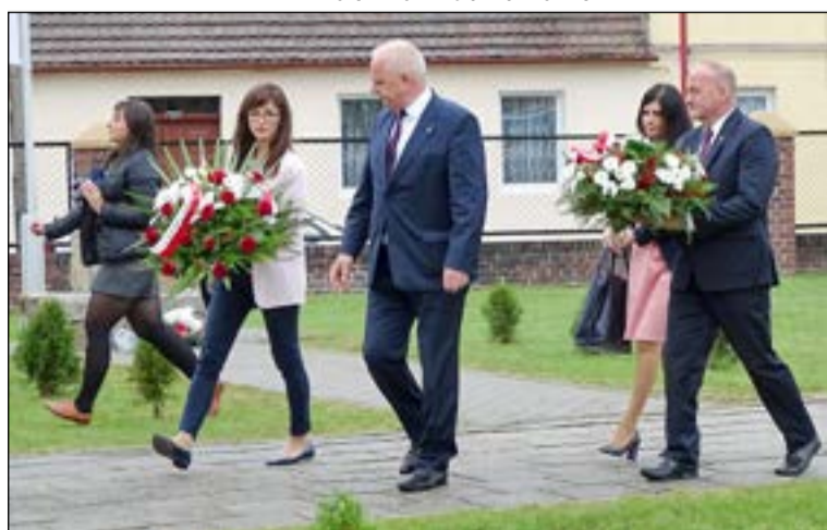
Wojewoda Lubuski i Burmistrz Jasienia złożyli kwiaty w miejscu pamięci