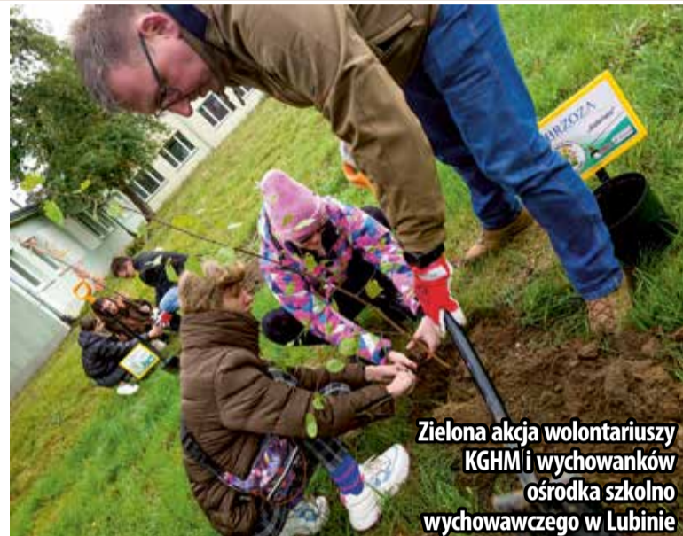
Zielona akcja wolontariuszy KGHM i wychowanków ośrodka szkolno-wychowawczego w Lubinie

Kilkaset drzew i krzewów, współdziałanie i wspieranie proekologicznych działań w Zagłębiu Miedziowym – wolontariusze KGHM i wychowankowie Ośrodka Szkolno-Wychowawczego w Lubinie zazielenili teren nowej siedziby instytucji. Każda z sadzonek otrzymała imię ucznia, który ją posadził.