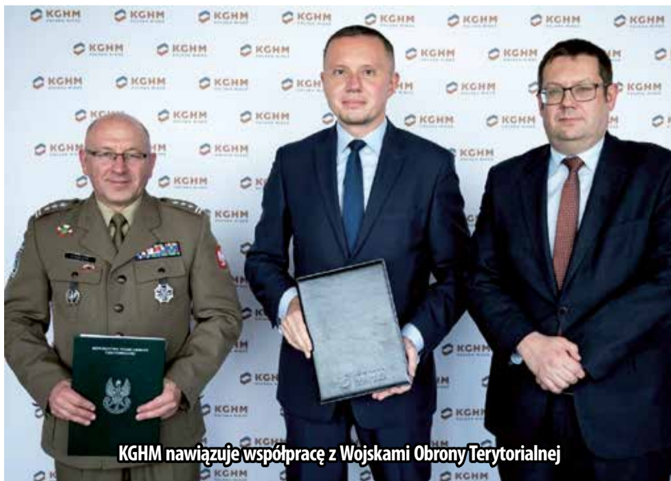
KGHM nawiązuje współpracę z Wojskami Obrony Terytorialnej

Dla podopiecznych tej placówki oraz Specjalnej Szkoły Podstawowej nr 6 z Lubina w kwietniu została również zorganizowana Integrycyjna Olimpiada Sportowa. W sumie w wydarzeniu wzięło udział blisko 200 uczniów. Rywalizowali w 10 konkurencjach, w tym w strzałach na bramkę, kręglach, rzucie oszczepem czy slalomie z piłką.