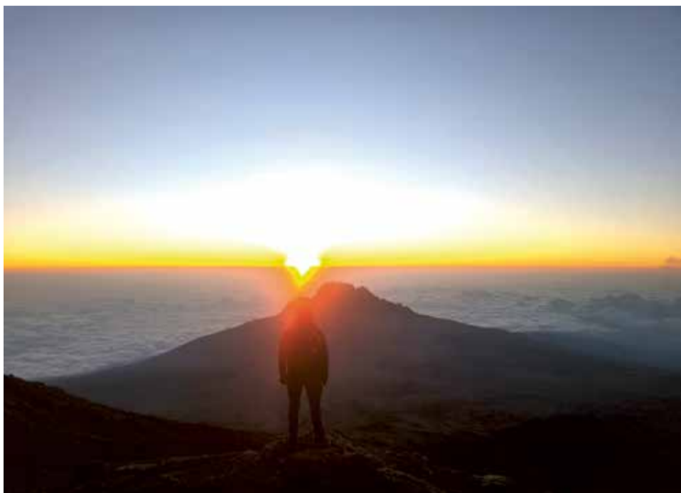
Wschód słońca podczas ataku szczytowego

Wysokość zaczęła dawać się we znaki. Woda, pomimo, że wlana była bardzo ciepła do camel бага szybko zamarzała w rurce i mogłem popijać jedynie herbatę z termosy. Krok za krokiem, godzina za godziną szliśmy pod górę. Ściana wydawała się nie mieć końca. Za każdym razem gdy popatrzyliśmy do góry, widzieliśmy czołówki innych wspinaczy znacznie wyżej. Po kilku godzinach zaczęły się pojawiać osoby, które schodziły w dół. Byli to wspinacze, którzy z różnych powodów musieli zrezygnować z dalszego podejścia. Czuliśmy się kiepsko, ale parliśmy do przodu. Przełom nastąpił, gdy zaczęło wschodzić słońce. Stanęliśmy akurat na przerwie na półce skalnej, z której udało się zrobić piękne zdjęcia wschodu słońca, w którego tle widać szczyt Mawenzi (5150 m n.p.m.) – drugą górę pod względem wysokości w masywie Kilimandżaro. Słońce napełniło nas energią i wiarą w sukces. Na wysokości ok. 5500 m złapał mnie kolejny kryzys. Miałem wrażenie, że płuca nie są w stanie dostarczyć moim mięśniom wystarczającej ilości tlenu. Co kilka minut musiałem się zatrzymać i głęboko oddychać, łapiąc powietrze jak ryba wyciągnięta z wody.