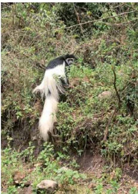
Gereza przy szlaku

Wysokość zaczęła dawać się we znaki. Woda, pomimo, że wlana była bardzo ciepła do camel бага szybko zamarzała w rurce i mogłem popijać jedynie herbatę z termosy. Krok za krokiem, godzina za godziną szliśmy pod górę. Ściana wydawała się nie mieć końca. Za każdym razem gdy popatrzyliśmy do góry, widzieliśmy czołówki innych wspinaczy znacznie wyżej. Po kilku godzinach zaczęły się pojawiać osoby, które schodziły w dół. Byli to wspinacze, którzy z różnych powodów musieli zrezygnować z dalszego podejścia. Czuliśmy się kiepsko, ale parliśmy do przodu. Przełom nastąpił, gdy zaczęło wschodzić słońce. Stanęliśmy akurat na przerwie na półce skalnej, z której udało się zrobić piękne zdjęcia wschodu słońca, w którego tle widać szczyt Mawenzi (5150 m n.p.m.) – drugą górę pod względem wysokości w masywie Kilimandżaro. Słońce napełniło nas energią i wiarą w sukces. Na wysokości ok. 5500 m złapał mnie kolejny kryzys. Miałem wrażenie, że płuca nie są w stanie dostarczyć moim mięśniom wystarczającej ilości tlenu. Co kilka minut musiałem się zatrzymać i głęboko oddychać, łapiąc powietrze jak ryba wyciągnięta z wody.