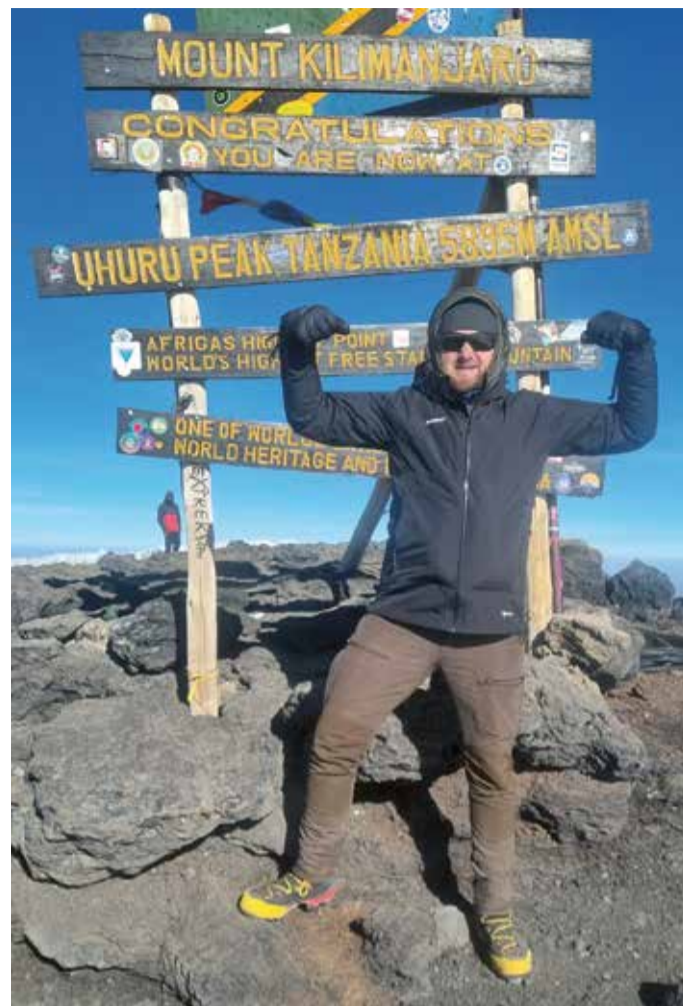
Upragniony szczyt Kilimandżaro