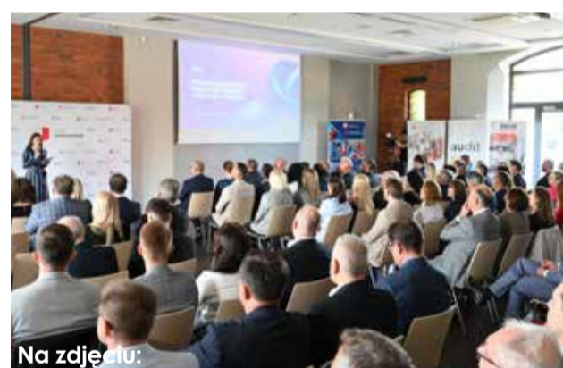
Na zdjęciu: Konferencja w Mierzęcinie - 22 maja 2025 roku.