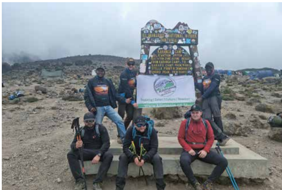
Wspólne zdjęcie pod tablicą w obozie Karanga

Po pełnej wzruszenia przerwie ruszyliśmy dalej. Po ok. 4 godzinach i 420 m wzniosu dotarliśmy do obozu Karanga. Jak zwykle czekał już na nas rozłożony namiot „jadalny” i pyszny, pożywny obiad. Nasi kucharze kolejny raz nas zaskoczyli. W czwartym dniu wyprawy dostaliśmy kurczaka z frytkami i pyszną surówkę ze świeżych