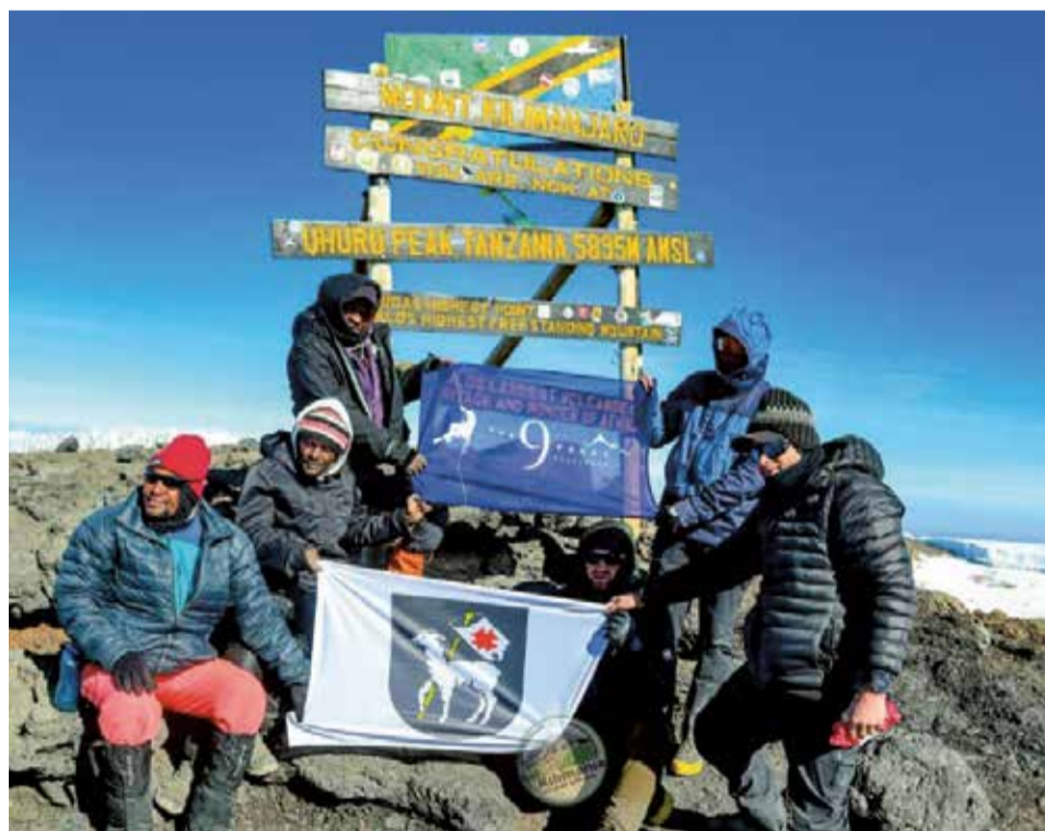
Na szczycie nie mogło zabraknąć sulęcińskich akcentów

Ze Stella Point zostało już tylko 40 min wspinaczki na Uhuru Peak. Nie wiem dlaczego, prawdopodobnie pod wpływem adrenaliny ostro ru-