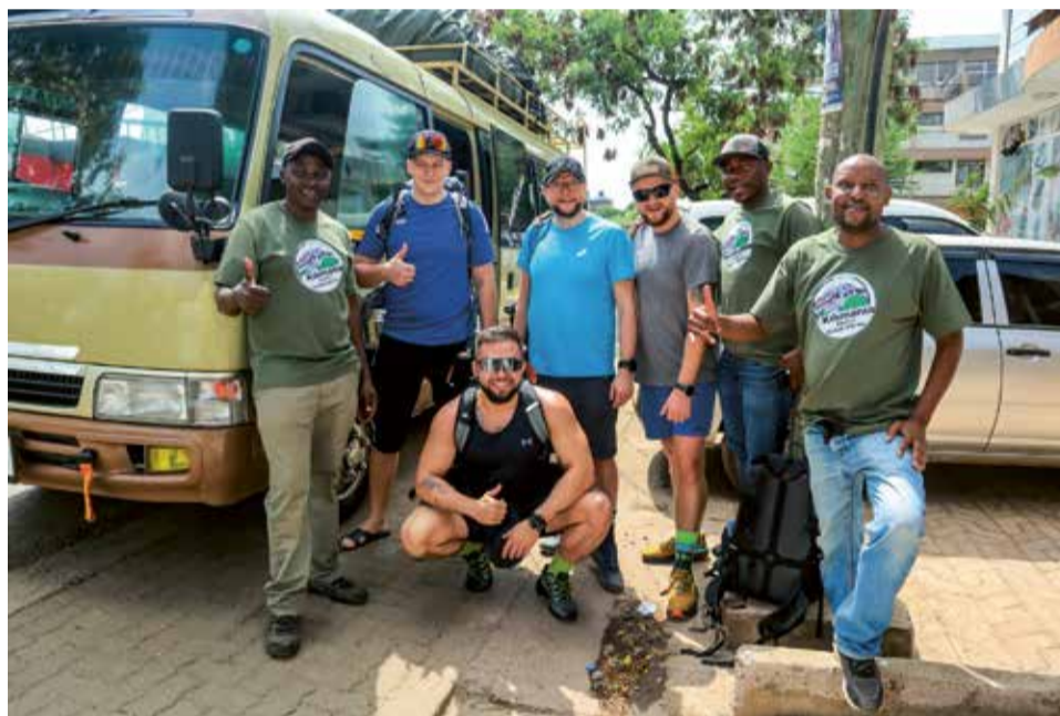
Spotkanie naszej ekipy z przewodnikami jeszcze przed hotelem

Pierwszy etap podróży samolotem do Paryża minął szybko w małym, zgrabnym Airbusie A220-300. Dolecieliśmy prawie punktualnie, co miało duże znaczenie, bo na przesiadkę do samolotu do Tanzanii mieliśmy niecałą godzinę. Niestety, nie spisała się obsługa naziemna lotniska, bo przez 20 minut czekaliśmy na pod-