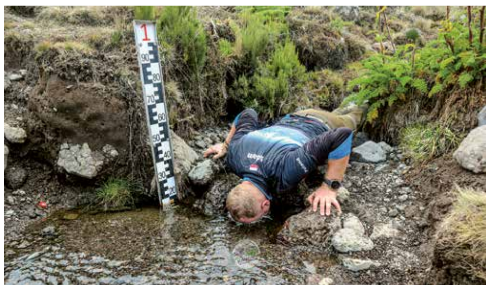
Miło było zanurzyć się w strumieniu