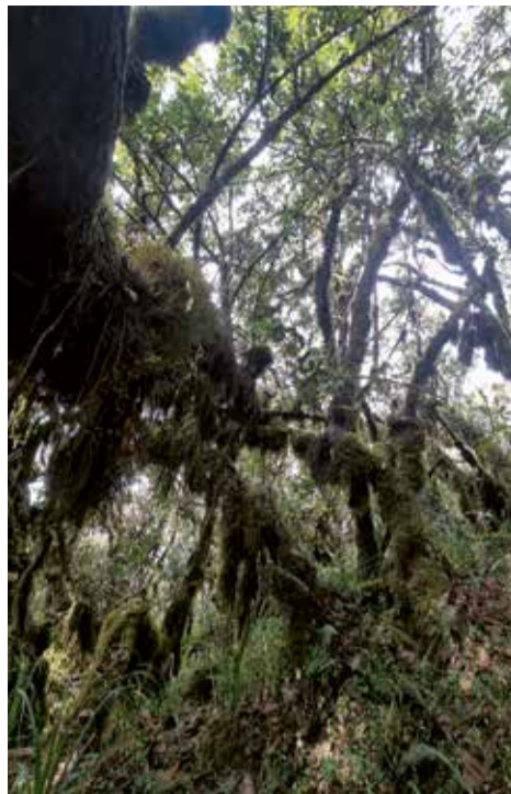
Droga przez dżunglę

Pomimo deszczu humory nam dopisywały i ok. godz. 18 dotarliśmy do