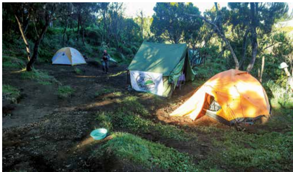
Pierwszy obóz - Machame Camp na wysokości 2835 m n.p.m.