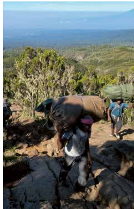
Porterzy w pracy

pierwszego obozu Machame Camp. Nasze namioty stały już rozłożone. Po godzinie w specjalnym namiocie jadalnym kucharz zaserwował nam kolację. Każdy posiłek zaczynał się od zupy. Były to zawsze polewki ugotowane z proszku. Zwykle całkiem smaczne. Zapewne ich najważniejszym zadaniem było rozgrzać nasze żołądki. W przypadku właściwego dania nigdy nie mieliśmy powodu do narzekania. Kucharz wspinał się na wyżyny biwakowego gotowania. W pierwszym dniu na kolację dostaliśmy smażoną rybę z ziemniakami z wody i