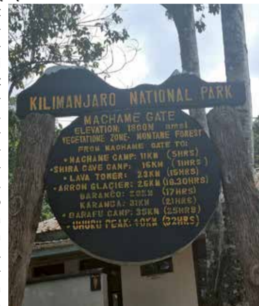
Początek drogi Machame Road, zwana również Whiskey Road