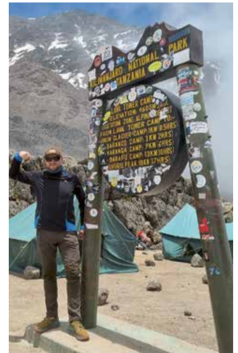
Lava Tower na wysokości 4600 m

Temperatura w nocy w Shira Camp spadła kilka stopni poniżej 0. W takich miejscach przydaje się ciepły śpiwór z termiką do przynajmniej -5 stopni.